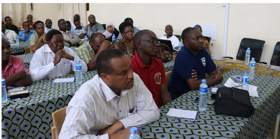
Baadhi ya watumishi ITA wakifuatilia mada wakati wa semina

Katika semina hiyo ya siku mbili, wafanyakazi hao wamepata mafunzo mbalimbali ikiwemo, uelewa wa magonjwa ambayo hayaambukizi, Maa-dili pamoja na Mkakati wa Nne wa Chuo cha Kodi. ●