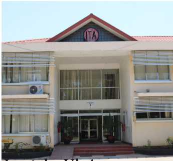
Imetoka Uk 4