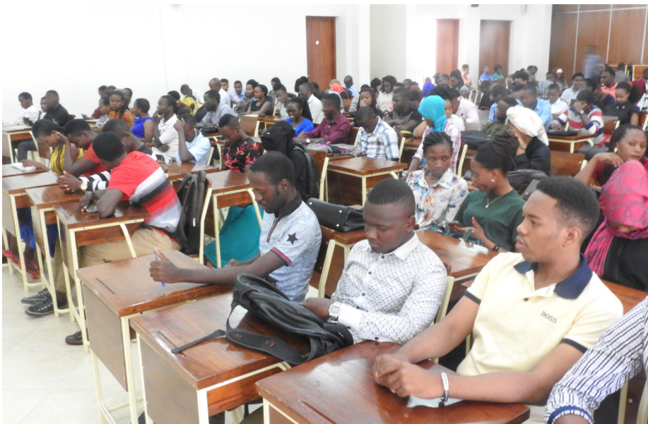
Baadhi ya wanafunzi wa mwaka wa kwanza wa masomo 2018/19 wakimsikiliza Naibu Mkuu wa Chuo cha Kodi taaluma, Utafiti na ushauri Dkt. Lewis Ishemoi (hayupo ktk picha)

Wanafunzi wapya wa masomo mwaka 2018/19 wamehimizwa kuzingatia masomo katika kipindi chote wawapo katika Chuo cha Kodi pamoja na kuutumia uhuru walionao kwa manufaa yao wenyewe.