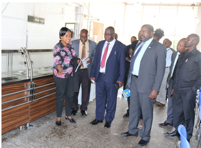
Mkuu wa Miliki za Chuo Joyce Mwaifuge akimuelezea Kamishna Mkuu kuhusu ukarabati wa jiko na sehemu ya kula chakula wanafunzi