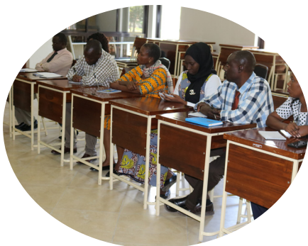
Baadhi ya washiriki wa kozi waki-fuatilia maelezo ya ufungaji wa mafunzo

hakama Kuu, msajili wa Mahakama Kuu pamoja na wanasheria wawili wa mamlaka ya Mapato Malawi (MRA). Pamoja na kozi hizo fupi Chuo cha Kodi pia kimeratibu na kuendesha kozi fupi kwa watumishi wa Bodi ya Mapato Zanzibar ikiwa ni utekelezaji wa makubaliano ya kuwajengea uwezo watumishi wa ZRB. ●