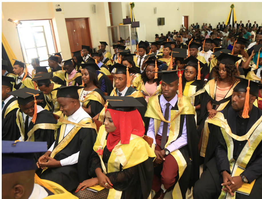
Baadhi ya wahitimu wakifuatilia matukio katika mahafali ya 11

Mahafali ya Kumi na Moja ya Chuo cha Kodi yamefanyika kwa mara ya pili katika ukumbi wa Chuo 'Multi-purpose' na kuhudhuriwa na wageni mbalimbali wakiwemo wawakilishi kutoka mamlaka za mapato Rwanda (RRA) na Malawi (MRA) pamoja